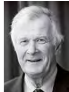
Friedrich GRAF von WESTPHALEN Germany / Allemagne