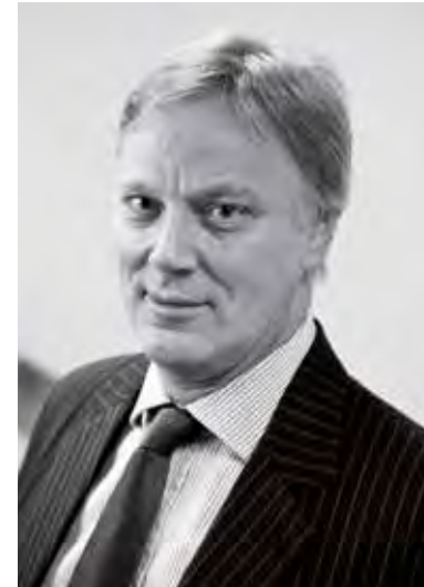
CCBE Third Vice-President Troisième vice-président du CCBE