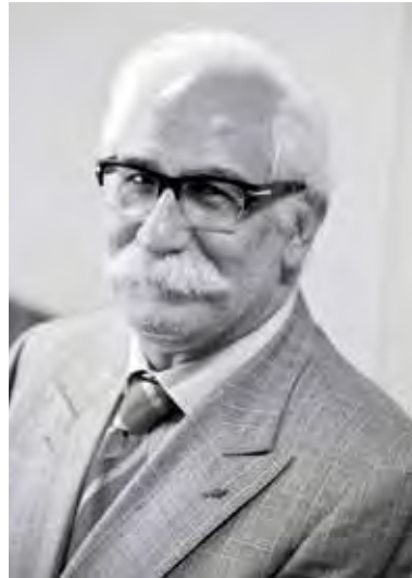
CCBE Second Vice-President Deuxième vice-président du CCBE