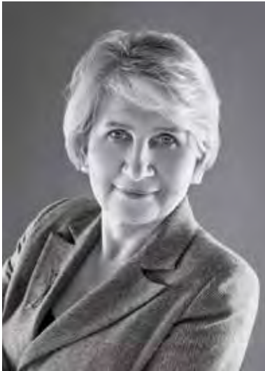
CCBE First Vice-President Première vice-présidente du CCBE